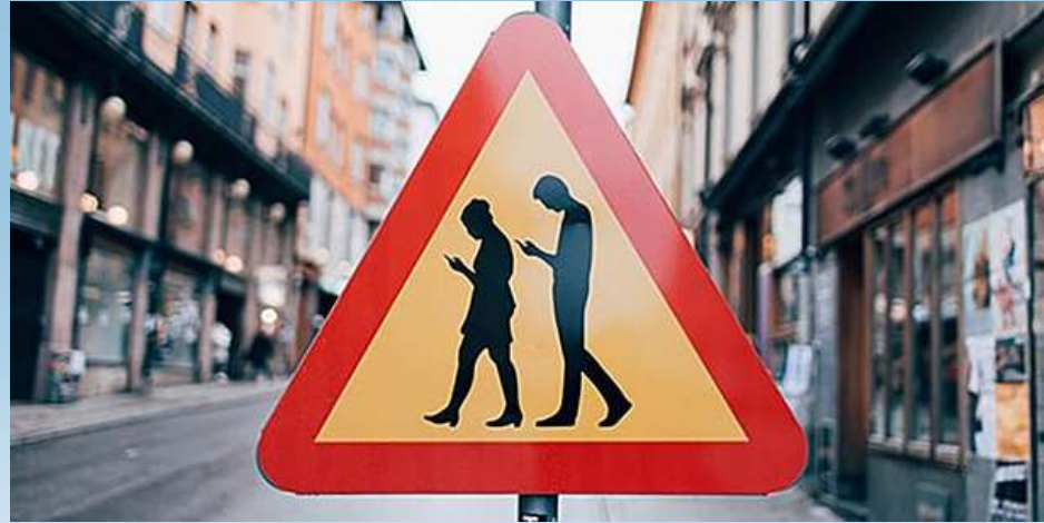
Pas op voor SMOMBIES

Door miniaturisering en WiFi, 3G, 4G, & app's 24/7 alles, altijd, overall beschikbaar